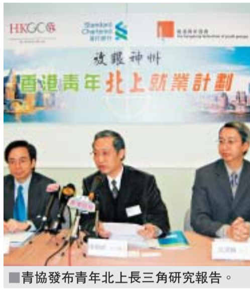
青協發布青年北上長三角研究報告。

香港青年協會昨天（三月十四日）公布的調查發現，青年對於長三角與本港青年發展的去向，普遍感到樂觀：在五百四十四名年齡介乎十五至三十四歲的被訪青年中，接近八成受訪青年認為長三角為香港青年提供多一條發展出路，七成半認為香港青年到長三角有發展空間。逾三成受訪者希望能在北上前提升普通話能力的訓練和建立當地人脈網絡。