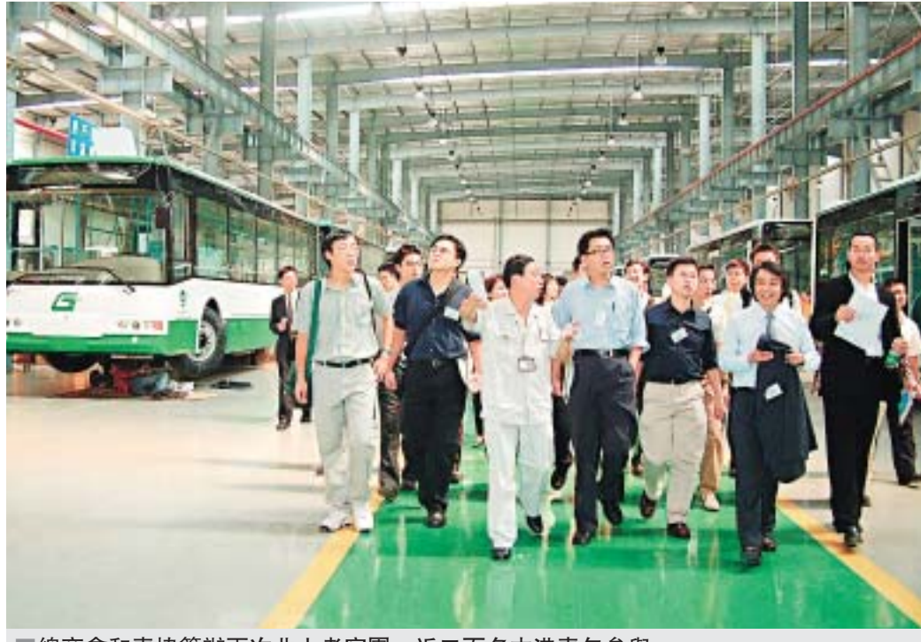
總商會和青協籌辦兩次北上考察團，近二百名本港青年參與。

上就業論壇」，邀請企業代表和北上港人出席，藉著互動式的討論和交流，為年青專才勾勒出內地經濟發展所帶來的機遇，並探討本港年青人應如何裝備自己，提升個人的競爭力。