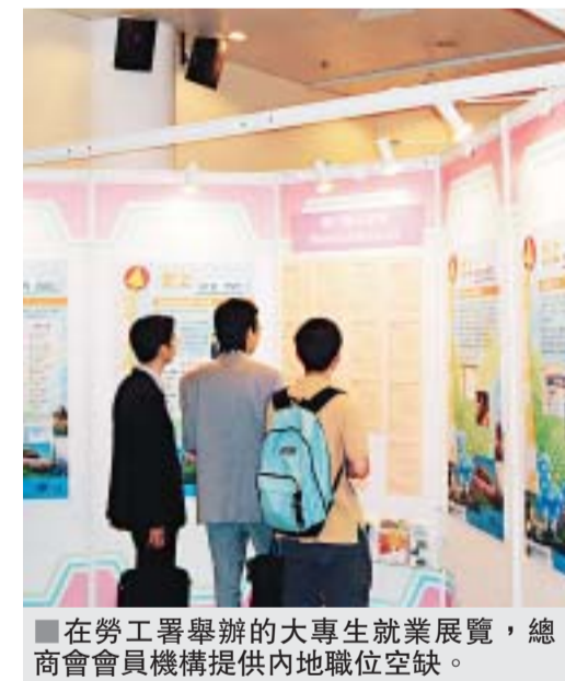
在勞工署舉辦的大專生就業展覽，總商會會員機構提供內地職位空缺。

上就業論壇」，邀請企業代表和北上港人出席，藉著互動式的討論和交流，為年青專才勾勒出內地經濟發展所帶來的機遇，並探討本港年青人應如何裝備自己，提升個人的競爭力。