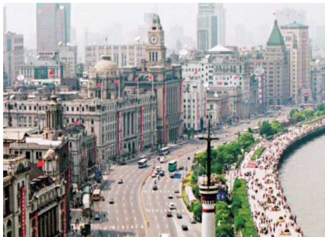
近年長三角經濟發展迅速，為本港青年提供了不少大展拳腳的機會。

他說：「長三角擁有優厚的發展潛力，是香港年青人磨練自我、增長見識的廣闊天地。」渣打歷年來培訓了不少本港專才到內地開展事業，現時仍以上海為總部，業務已發展至國內十五個城市。