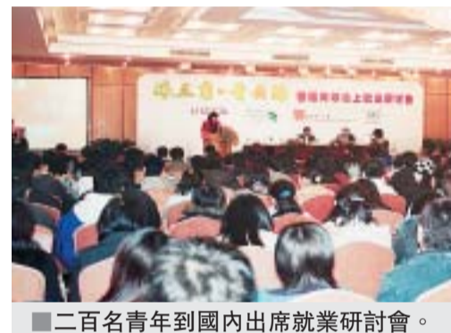
二百名青年到國內出席就業研討會。

不過年青一輩對北上長三角發展暫未見熱烈，只有約一成多透露會考慮到長三角發展事業；若以0-10分（10為最高）計，受訪青年對自己在當地發展的信心平均分為3.79，而自評對長三角的平均認識程度則只